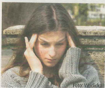
Hilfe für Kopfschmerzpatienten