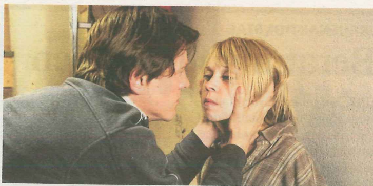
Achteinhalb Jahre lang war Natascha Kampusch gefangen.