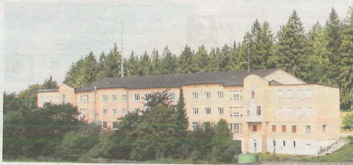
Modernes Wohnen in der ehemaligen Landwirtschaftsschule

Auf dem Areal der ehemaligen Landwirtschaftsschule werden neue Wohnungen geschaffen, die diesen speziellen Anforderungen gerecht werden. In 20 Minuten von Linz aus erreichbar und dennoch in idyllischer Ruhelage am Waldrand.